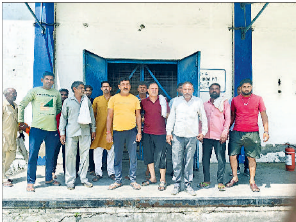
कैथल। सीवन में पत्रकारों को जानकारी देते वेयर हाउस के आसपास के लोग

वेयरहाउस में रखी गेहूं की बोरियों में सुरसुरी (कीड़े) लग चुकी है, जो अब हवा के साथ आसपास के इलाकों तक फैल रही है। हालात ऐसे हो गए हैं कि सुरसुरी घरों के आंगन और कमरों से होते