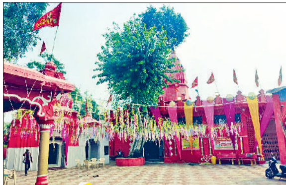
जींद। पर्व को लेकर सजाया जा रहा जयंती देवी मंदिर।

■ गणेश मूर्ति स्थापना मुहुर्त 11:05 मिनट से लेकर दोपहर 01:40 तक शुभ मुहुर्त। ■ रिद्धि सिद्धि क्लब करेगा तीन दिवसीय गणेश महोत्सव का आयोजन ■ श्रद्धालु दस दिनों तक बप्पा को घर विराज करेगे सेवा, फिर होगा विसर्जन