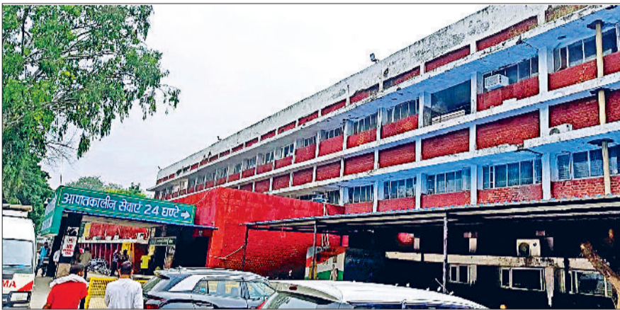
जींद। नागरिक अस्पताल की पुरानी बिल्डिंग।

इसका रेनोवेशन किया जाएगा। हालांकि पहले नया भवन बनाने का विकल्प भी तलाशा जा रहा था लेकिन अब इस निर्णय को छोड़ दिया गया है। अस्पताल की मरम्मत के लिए लोक निर्माण विभाग ने 14 करोड़ 91 लाख रुपये का एस्टीमेट बनाया है। इसके तहत पुराने अस्पताल के भवन को गोहाना रोड की ओर टफंड ग्लास से ढका जाएगा। इससे जहां भवन आकर्षक लगेगा वहीं मजबूत भी होगा। साथ