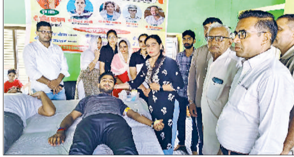
जीद। शिविर में रक्तदाताओं के साथ मौजूद मुख्यातिथि।

पर विराजमान हो रहे हैं। यह सिलसिला रुकना नहीं चाहिए बल्कि एकजुटता के साथ और भी जागरूक होकर युवा पीढ़ी के भविष्य को उज्वल बनाने में पूरी जी.जान लगानी चाहिए। अतीत में सामंतवादी और जागीरदारों ने पिछड़ा वर्ग के लोगों को जमकर शोषण किया। उसके बाद अंग्रेजों ने भी शोषण करने में कोई कसर नहीं छोड़ी। लेकिन पिछड़ा वर्ग के कर्मठ लोग अपनी मेहनत और महापुरुषों के दिखाए रास्ते पर चलते हुए आगे बढ़ते गये। जिसके परिणाम स्वरूप आज पिछड़ा वर्ग के लोग किसी भी क्षेत्र में कम नहीं हैं।