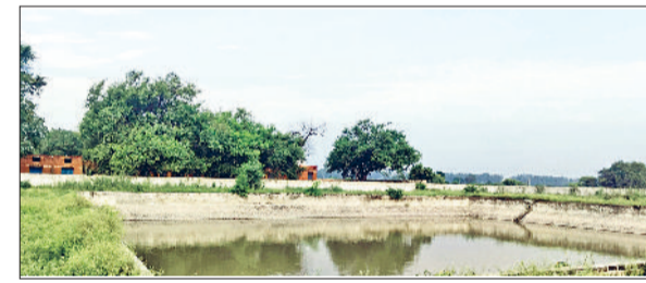
अलेवा। नहरी पानी की मोटर नहीं चलने से बंधाना जलधर में भरे दिखाई देते पानी के टैंक।

बंधाना गांव स्थित जलधर में लाखों रुपये खर्च कर नहरी पानी के लिए करीब छह माह पूर्व लगाई मोटर के चलाने के लिए शायद विभाग को किसी विधायक से फीता कटवाने का इंतजार है। विभाग द्वारा जलधर में नहरी पानी के लिए मोटर लगाए जाने के बाद भी ग्रामीणों को नहरी पानी तो मिलना दूर की बात, 15 दिनों से सबमर्सीबल के खराब होने से ग्रामीणों को पीने के पानी के लाले पड़े हुए हैं। ग्रामीणों ने बताया कि