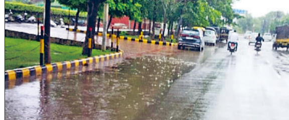
कैथल। चल रही बरसात का दृश्य।

गति भी तेज रही। जिसने उमस से राहत दिलाई। आकाश में लगे बादलों के जमावड़े से बारिश के आसार भी बने रहे। रविवार को शाम तक हवा की गति दस किलोमीटर तक रही।