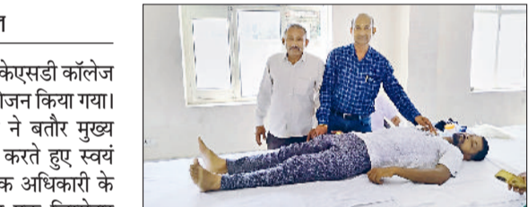
रूप में लेना चाहिए और नियमित रूप से रक्तदान करना चाहिए। समय पर रक्त न मिलने के कारण लाखों लोग जान गंवा देते हैं, लेकिन ब्रह्मकुमारी आश्रम जैसी सामाजिक एवं धार्मिक संस्थाएं समय-समय पर इस प्रकार के शिविर का आयोजन करके रक्त की कमी को पूरा करने की कोशिश करती हैं। रेडक्रॉस सोसाइटी द्वारा भी रक्तदान शिवरो का आयोजन किया जाता है।